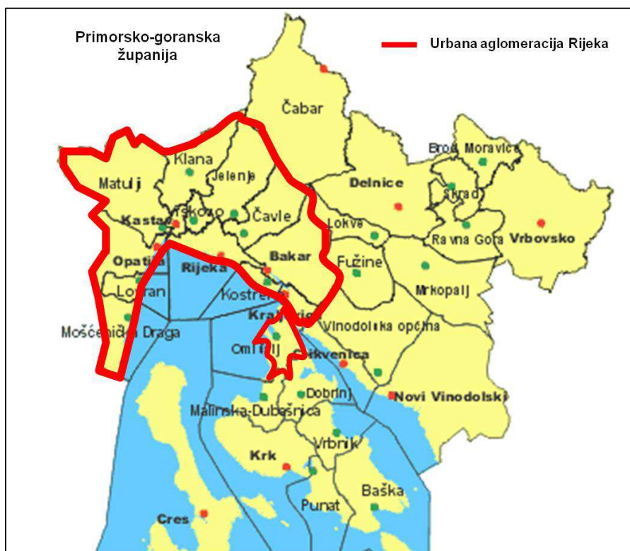
Slika 3. Prijedlog područja Urbane aglomeracije Rijeke

Temeljem dostignute razine suradnje putem komunalnih društava kao i suradnji u razvoju prometne i komunalne infrastrukture, Grad Rijeka predlaže ustrojavanje urbane aglomeracije Rijeka na području kojeg čine: Grad Bakar, Općina Čavle, Općina Jelenje, Grad Kastav, Općina Klana, Grad Kraljevica, Općina Kostrena, Općina Lovran, Općina Matulji, Općina Mošćenička Draga, Općina Omišalj, Grad Opatija i Općina Viškovo.